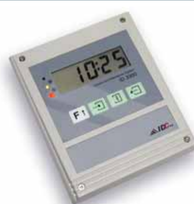
ID3300 Presencia y Accesos