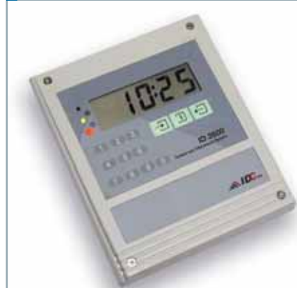
ID3500 Presencia y Producción