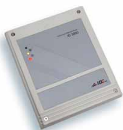
ID3000 Presencia y Accesos

Versiones disponibles para Tarjeta Magnética, iButton, Tarjeta de proximidad, Biometría y lector código de barras.